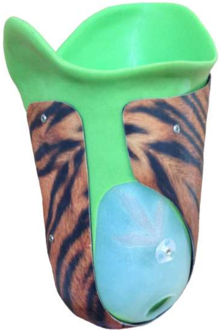
Abbildung Mit dem Icke- ist der Silikonschafts am Carbonrahmen befestigt.